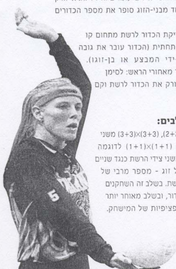
המשך בעמ' 49