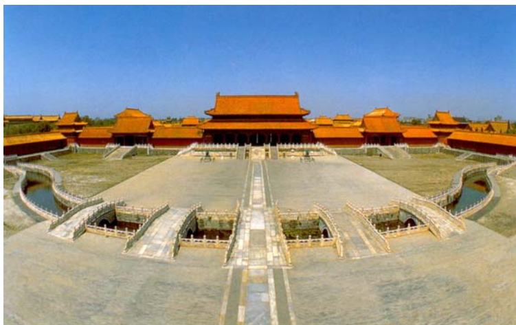
מעבר 5 ה"מרידיאנים" - ( השם בסינית) בכניסה לארמון

כדי להגיע למגע עם הקיסר, או כפי שאנו מבינים מהדימוי - להגיע לליבו של אדם. אנו חייבים לעבור 3 תחנות המייצגות 3 כישורים רגשיים. ההקבלה בין האיברים - לרגשות תהיה ברורה יותר אם ניקח דוגמה מהירארכיית תפקידי השרים בממשל- בהמשך. כך נבין את סוד המורכבות ברצון לאחד מערך שלם של גוף / נפש שבכונות הרפואה הסינית. או בראייה הסינית קשר "שמיים- ארץ". מערך כזה הוא בעייתי מבחינת כלי המדידה המדעיים המערביים, אך לא בעיני המיסטיקן הסיני.